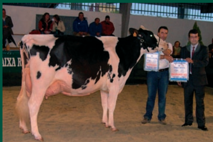
Pozo Lee 4760