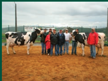
GANDERÍA NODI e GANDERÍA VEIGUEIRO de Vilamartín Grande - Barreiros - Lugo