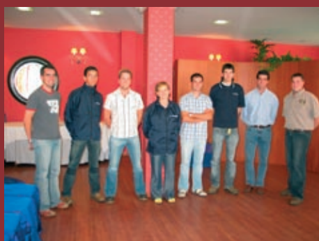
Mestres do Curso e premiados.