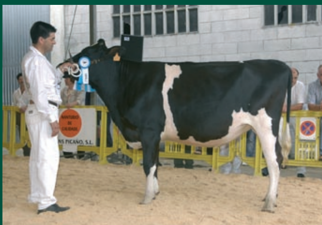
Arca Cubeiro Nika XOVENCA CAMPIONA