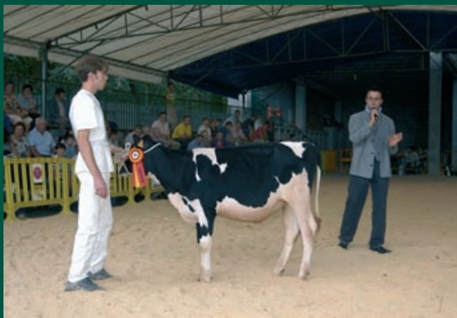
Pereira Louro Princesa BECERRA CAMPIONA