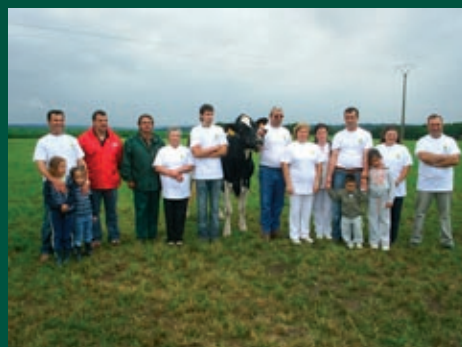
Ganderías: XERCAS-PORTALOUZA, XERCAS-SAT CAVADAS, XERCAS-CASA PERNAS, XERCAS-CASA GIL de Xermade - Lugo.