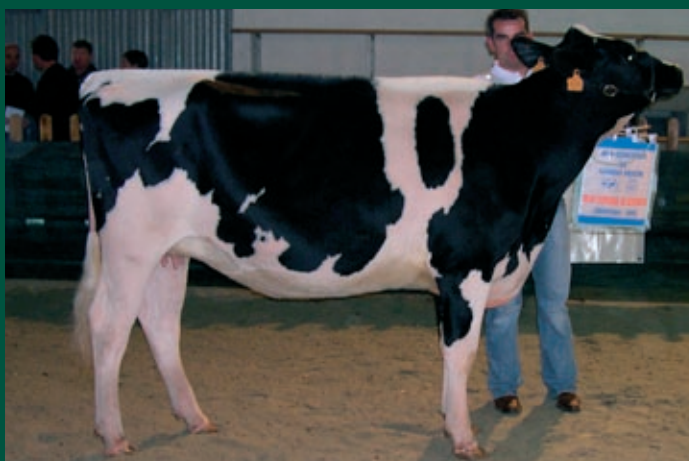
Anibal Champion Aleluya IV