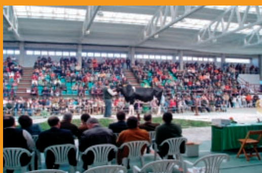
Pradeira Inquirer 217