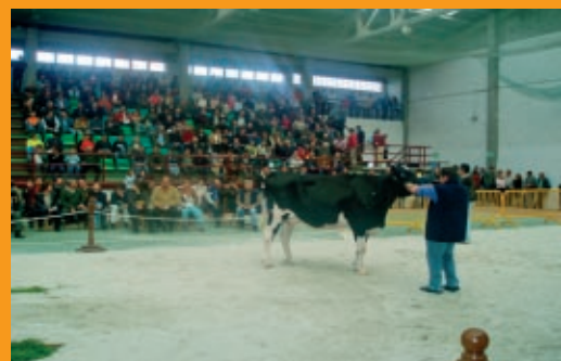
A Devesa Champion Rula