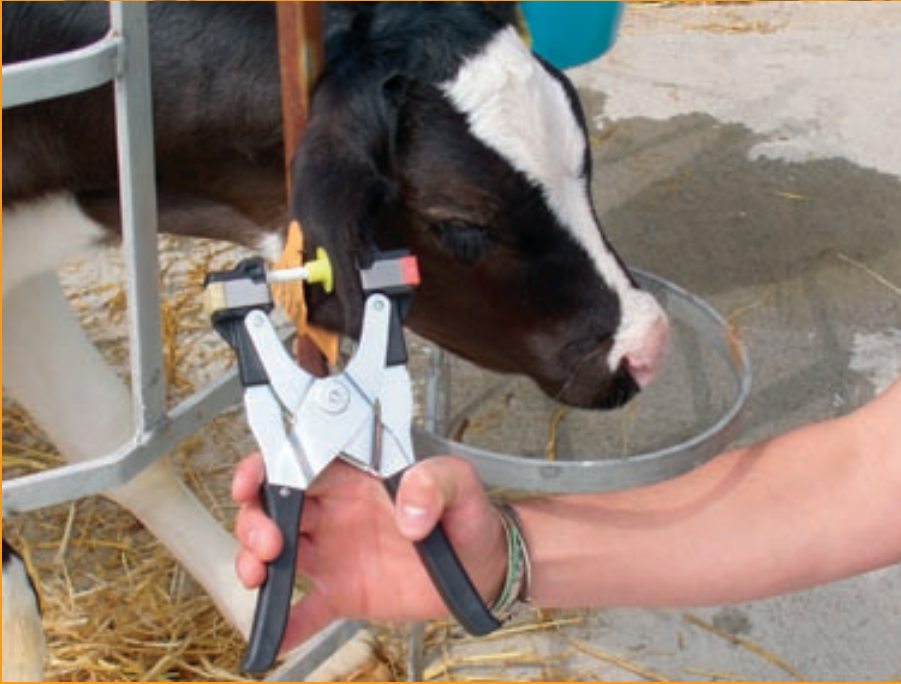
Sistema de toma de mostras para a búsqueda de Antixeno de BVD

devastadores nunha explotación causando perdas por baixas de animais, abortos e problemas de fertilidade derivados da acción xenital do virus, gastos veterinarios, etc.