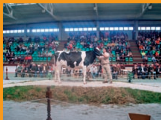
Carreira Gilbert 2686